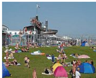
Wellenbad am Strand